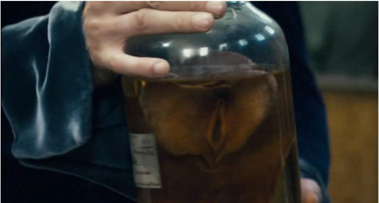
Fotografia 7 – Frame do filme Vênus negra .