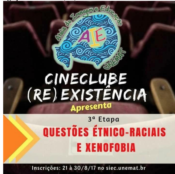
Fotografia 2 – Arte de divulgação Cineclube (Re)Existência. 2017.