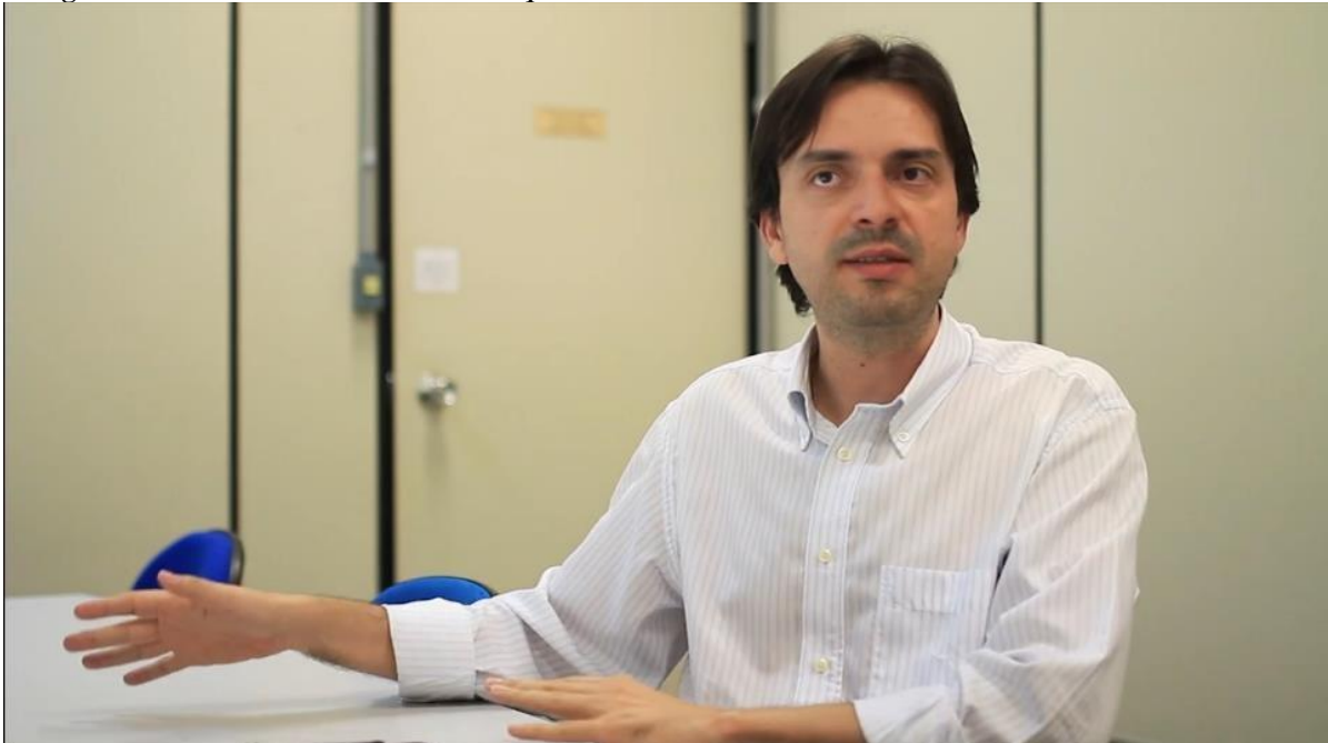
Fotografia 9 – Frame do filme O Haiti é aqui .

As falas anteriores, editadas em sequência no documentário em questão, abordam o mesmo assunto: a diferença do tipo de tratamento dado à população branca e à população negra na sociedade brasileira. Apesar de serem depoimentos sobre o mesmo assunto, as perspectivas são completamente diferentes.