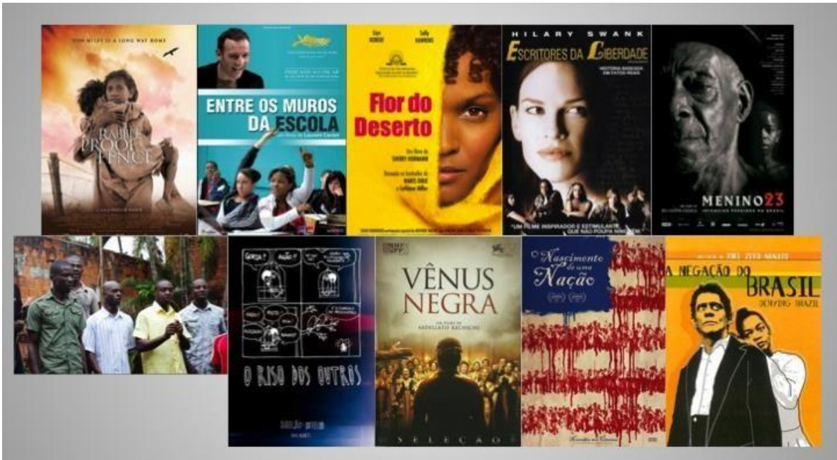
Fotografia 5 – Compilação de pôsteres e frame dos filmes exibidos durante a 3ª etapa do Cineclube (Re)Existência.