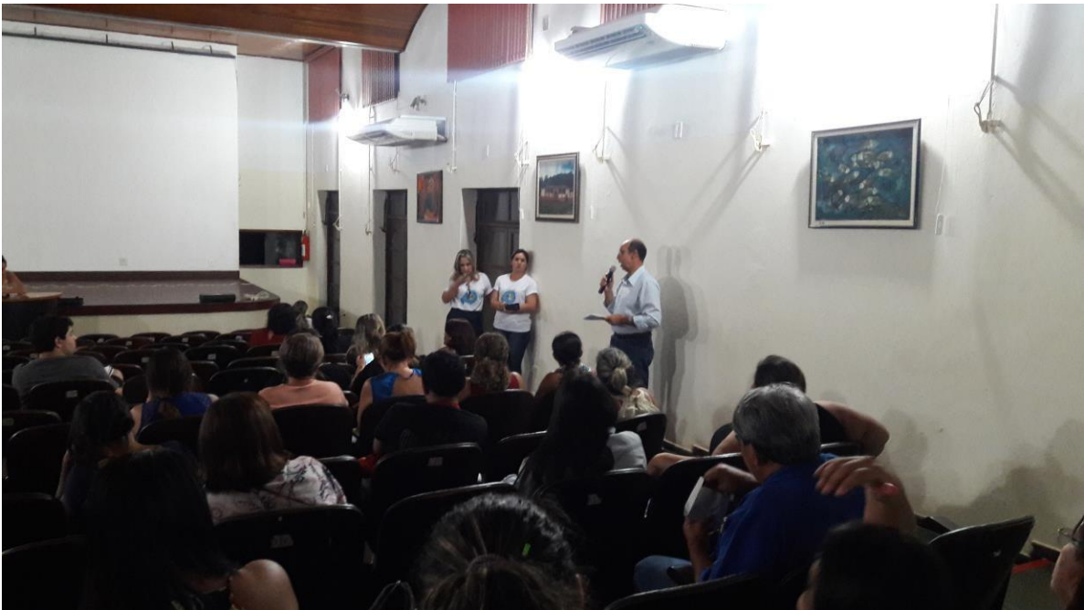
Fotografia 4 – Sessão do Cineclube (Re)Existência, Centro Municipal de Cultura de Cáceres (MT). 2018.