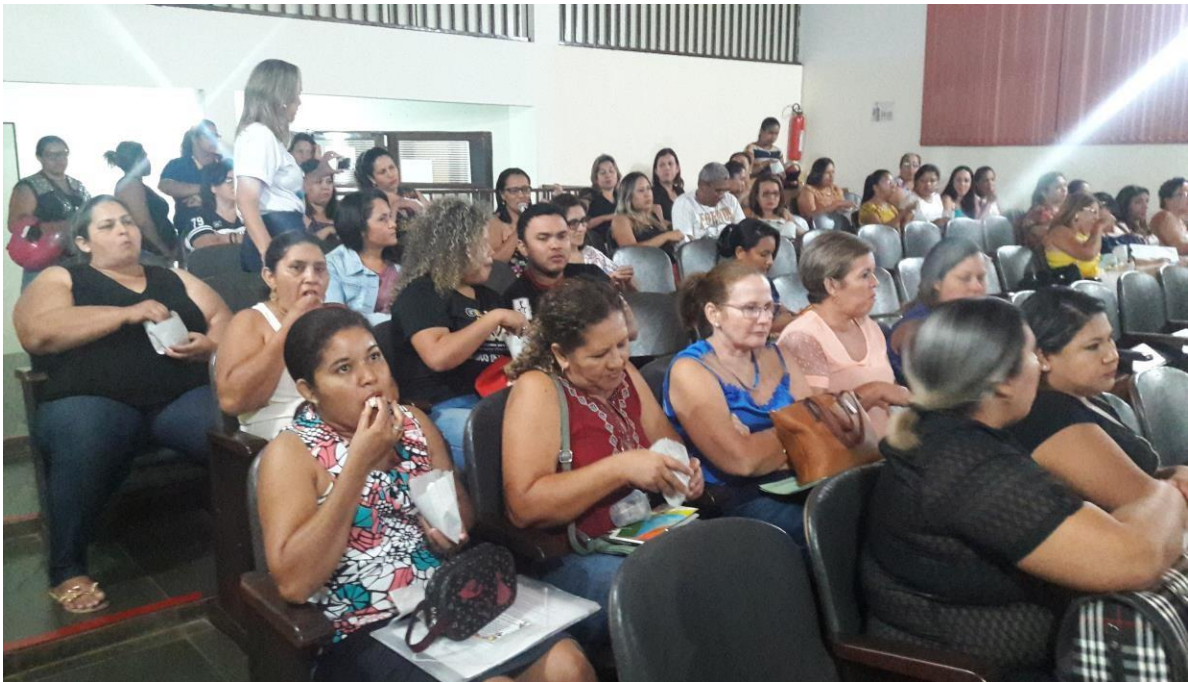
Fotografia 3 – Sessão do Cineclube (Re)Existência, Centro Municipal de Cultura de Cáceres (MT). 2018.