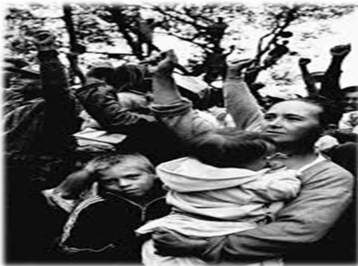
Figura 5 - Mulher sem-terra em manifestação do MST no Paraná