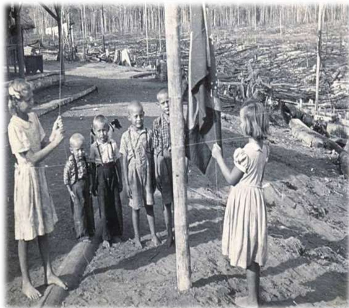
Figura 2 - Hasteamento da bandeira na Gleba Arinos (1956)