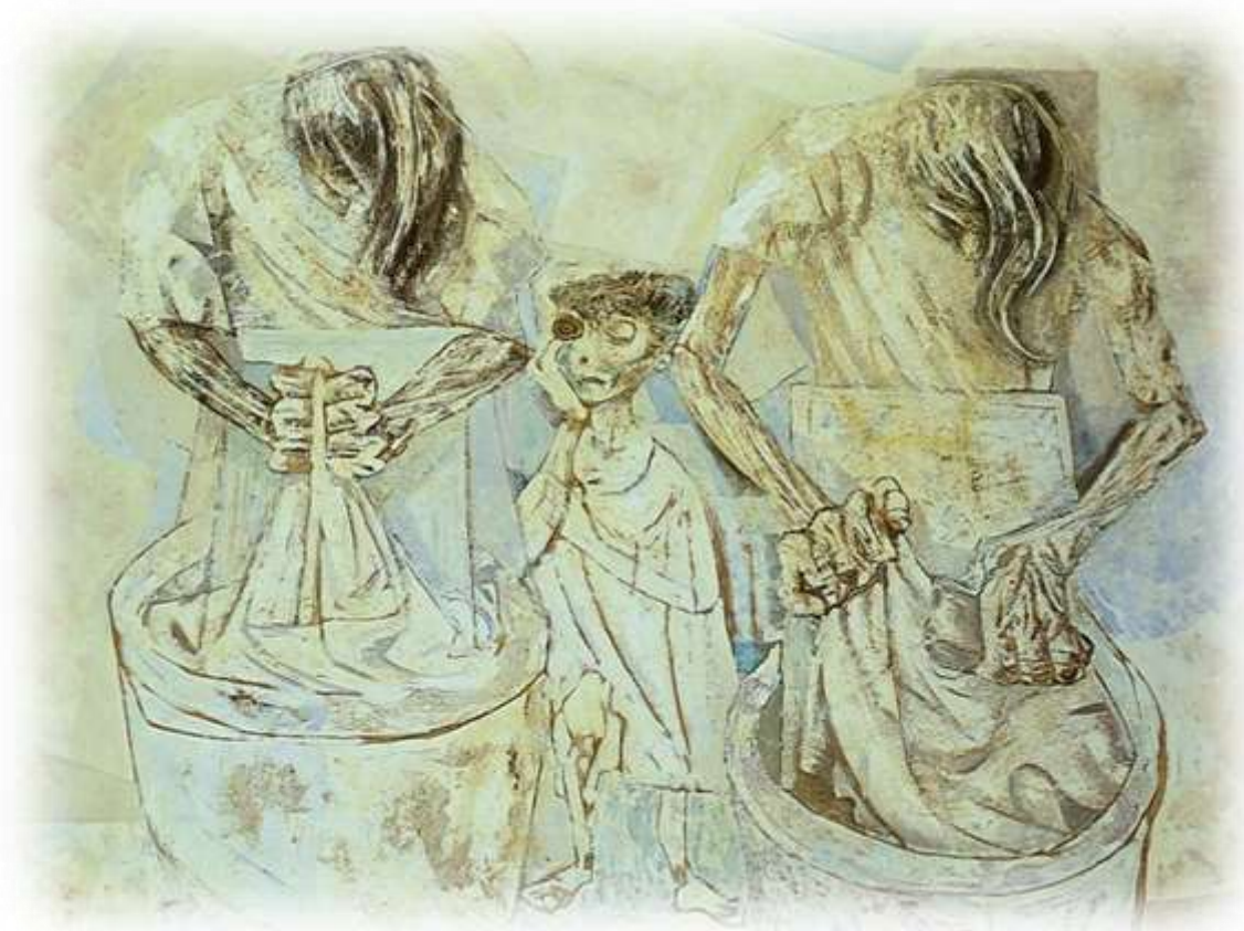
Figura 1 - As lavadeiras (Cândido Portinari)