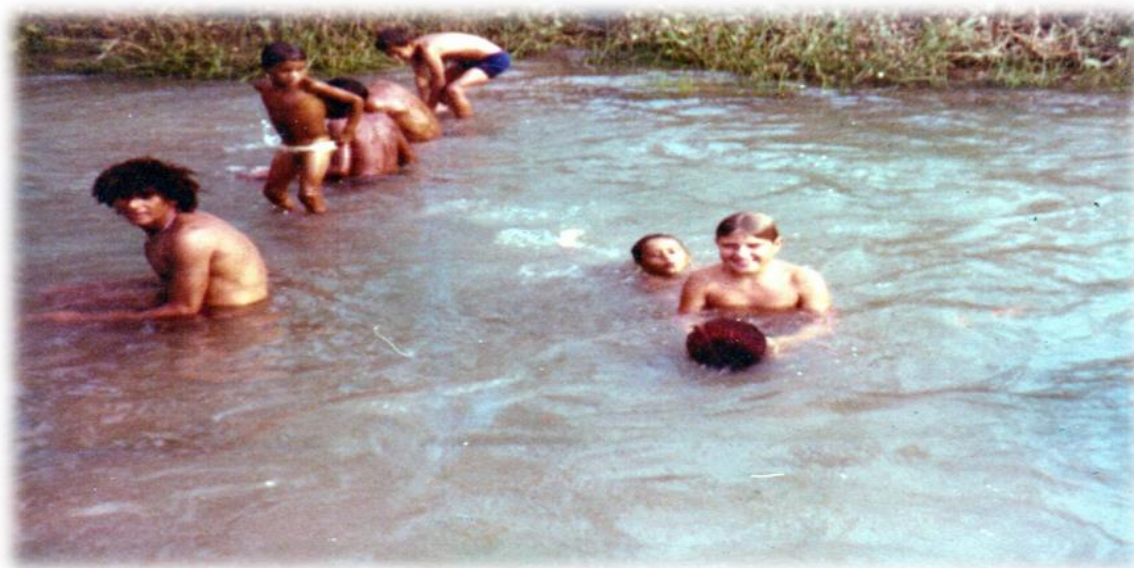
Fotografia 7 - Crianças/alunos em momento de lazer no Rio Pires de Sá, 1970