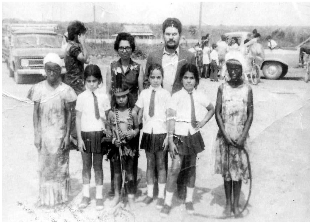
Fotografia 8 - Apresentação cultural da Escola Wilson Camargo, 1960