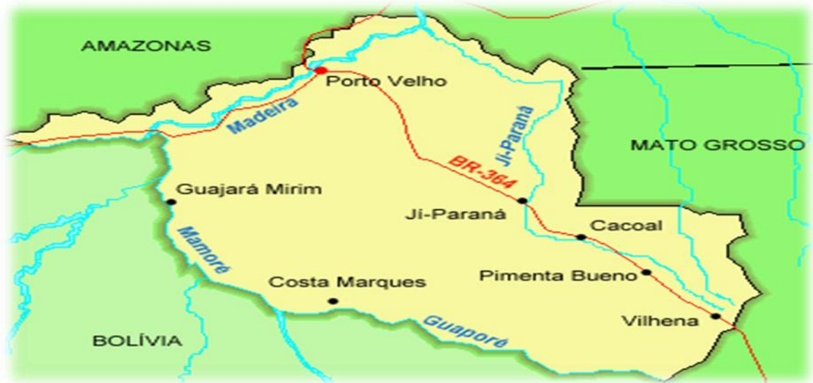
Figura 2 - Localização do município de Vilhena/RO as margens da BR-364