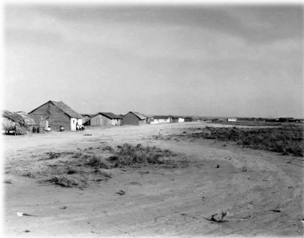
Fotografia 1 - Primeiras Casas de Vilhena/RO em 1960