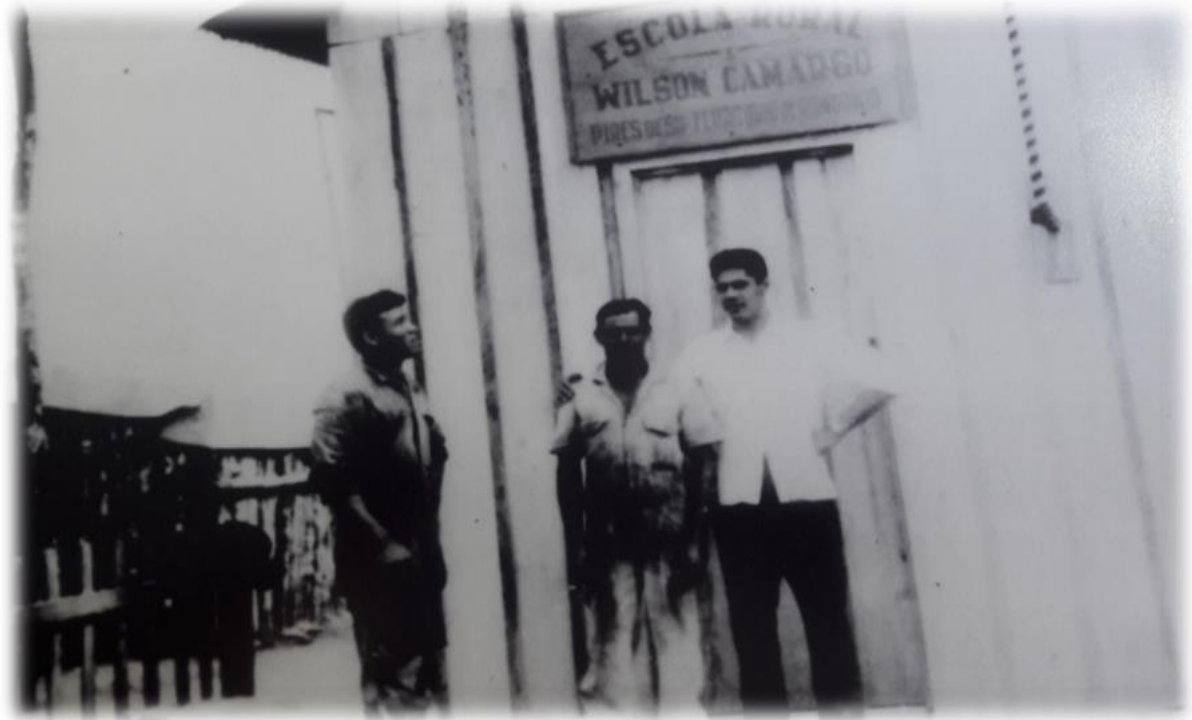
Fotografia 3 - Primeira escola de Vilhena “Escola Rural Wilson Camargo”

Fonte: Arquivo de memória pessoal “Camargo Corrêa S/A”.