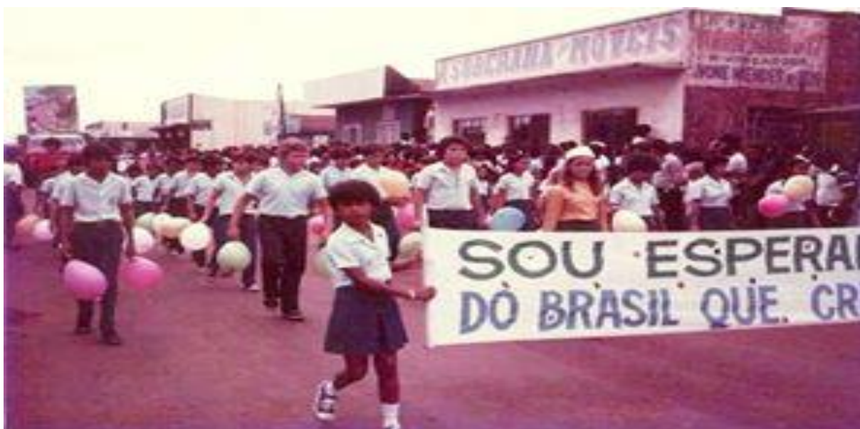
Fotografia 11 - Desfile de 7 de setembro em comemoração a Independência do Brasil, década de 80