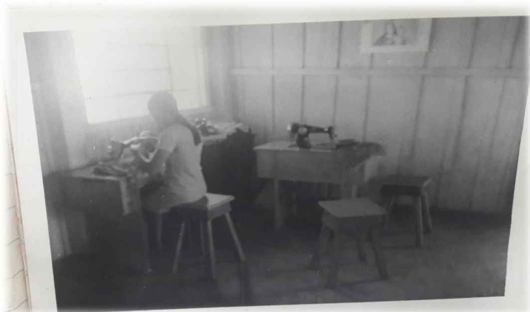
Fotografia 5 - Curso de corte e costura para as adolescentes/ mulheres, década de 1970