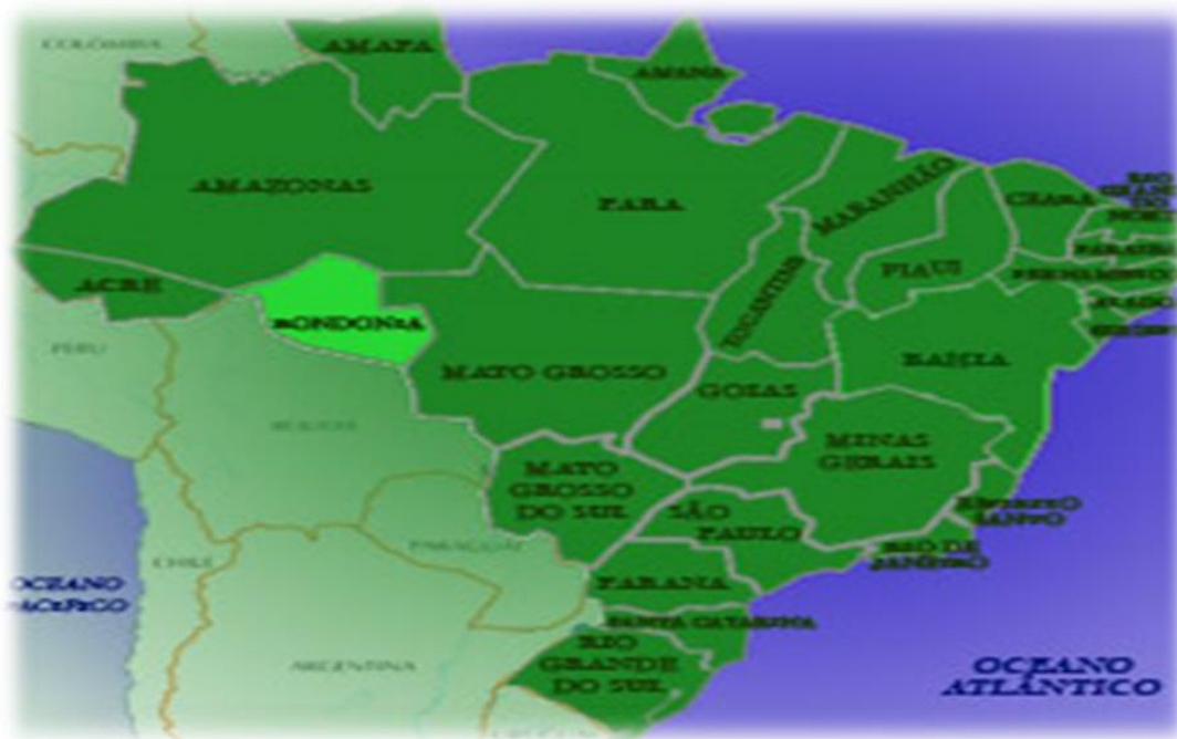
Figura 1 - Mapa do Brasil: localização de Rondônia