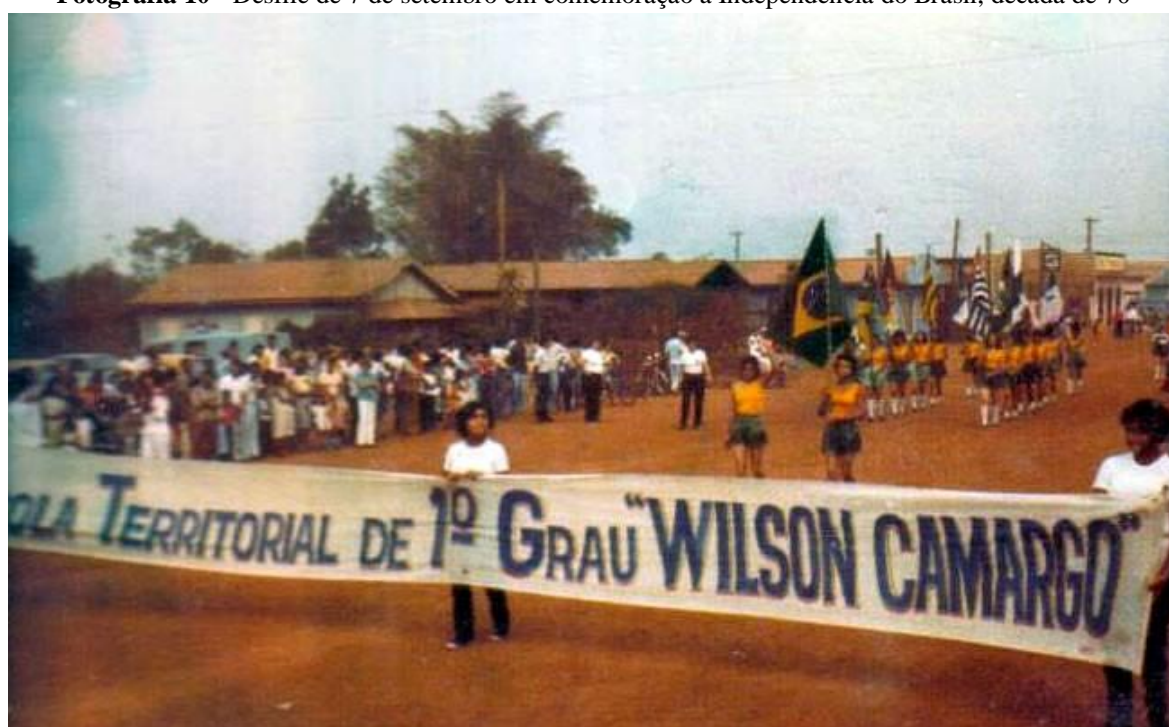
Fotografia 10 - Desfile de 7 de setembro em comemoração a Independência do Brasil, década de 70