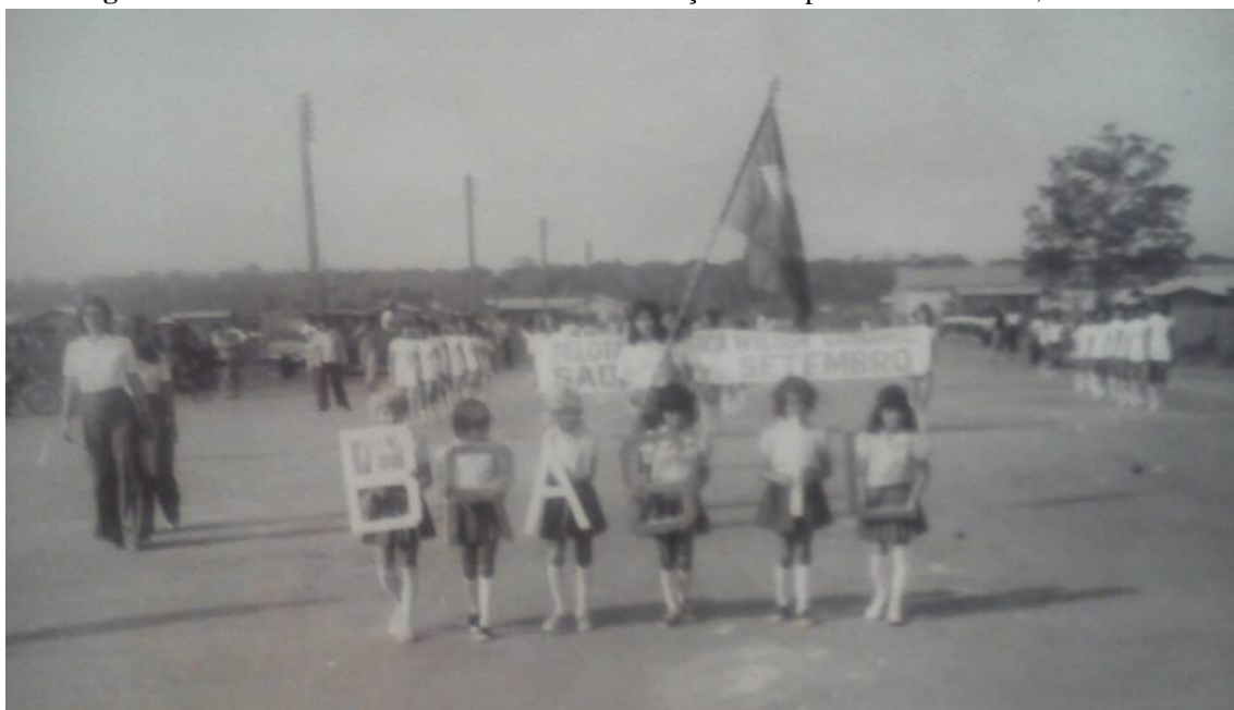
Fotografia 9 - Desfile de 7 de setembro em comemoração a Independência do Brasil, década de 60