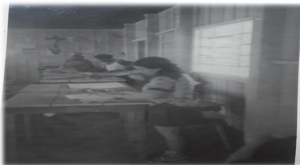
Fotografia 6 - Curso de corte e costura/riscos, desenhos e medição, década de 1970