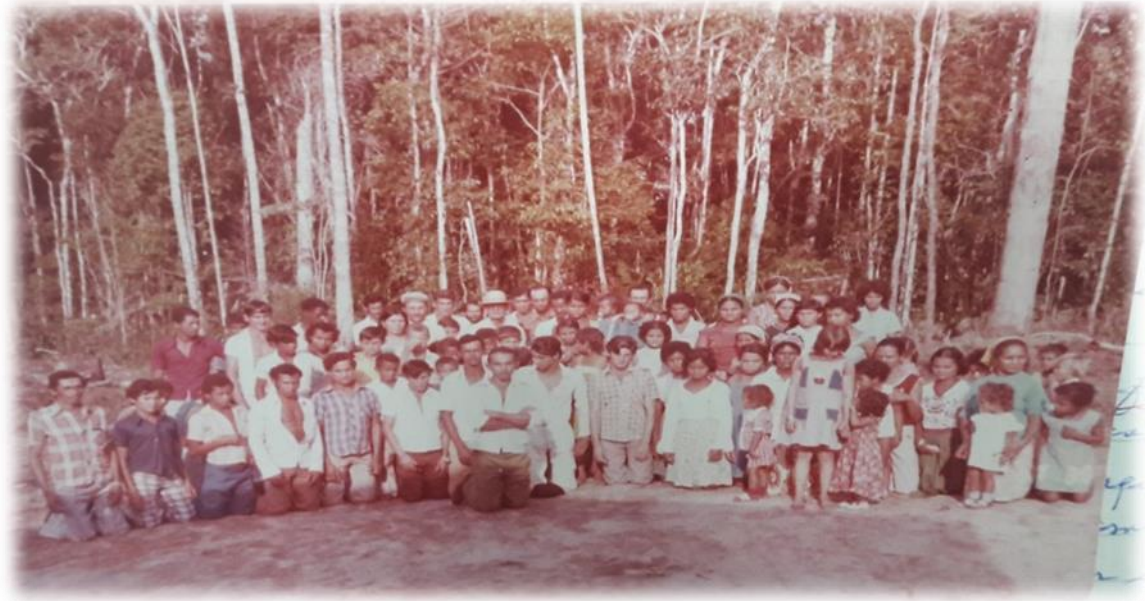
Fotografia 4 - Comunidade formada na Gleba Padronal, 1970