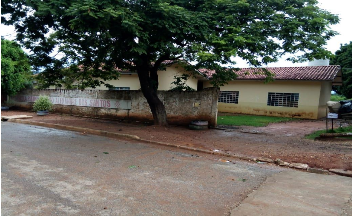
Fotografia 1 – Escola Estadual Bento Alexandre dos Santos (EEBAS)