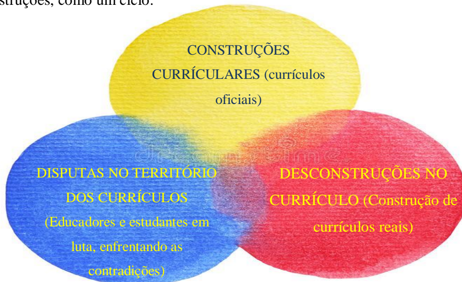
Imagem 3: Elaborada pelo autor com base nos acúmulos teóricos acima tratados sobre as concepções de currículo.

Quando falamos em currículo, parece que estamos falando de uma única coisa, um único conceito. Mas para nós currículo é um emaranhado de construções, disputas e desconstruções, como um ciclo: